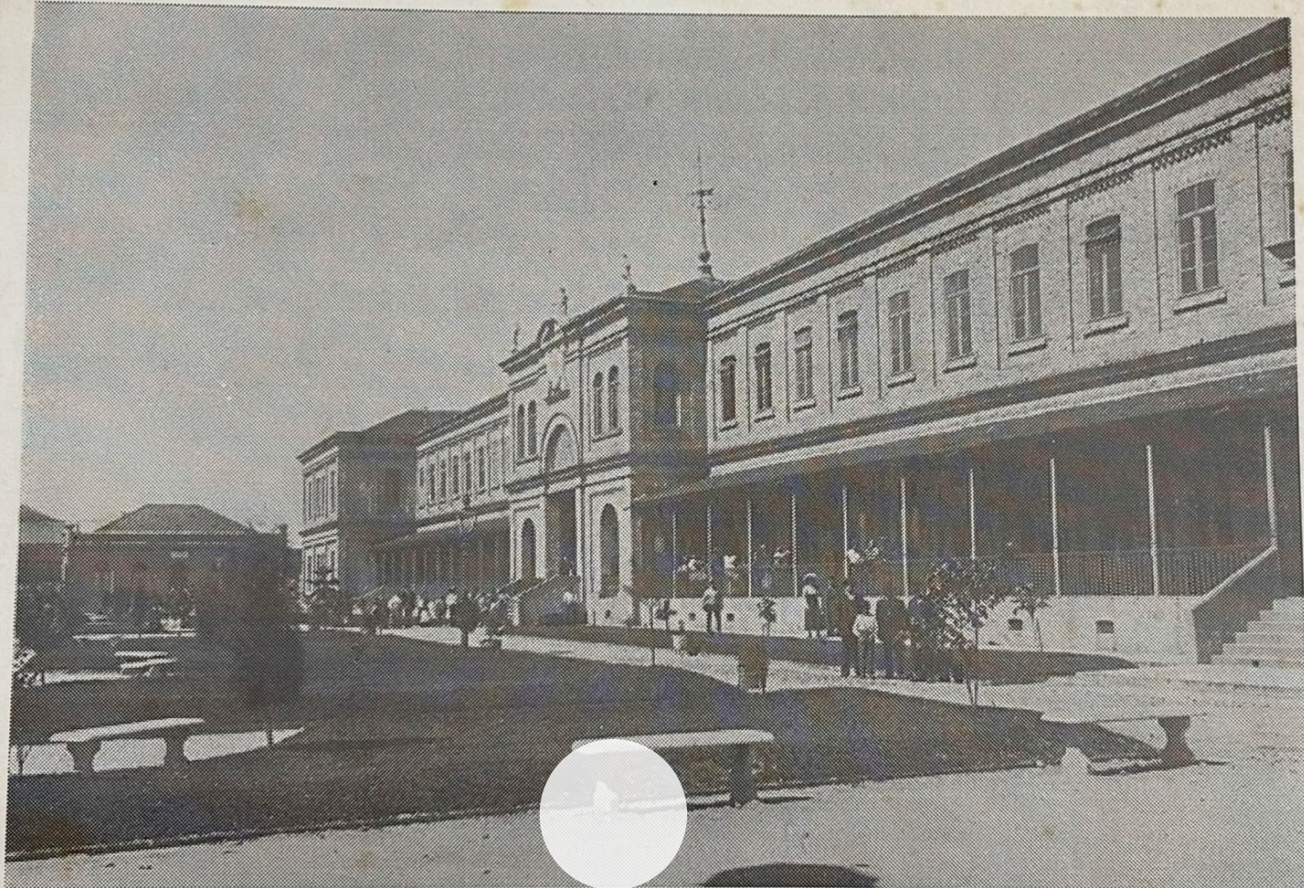
Hospedaria dos Imigrantes

Cartão postal (frente) com foto antiga da fachada e jardim da Hospedaria de Imigrantes do Brás. Sem data, autoria desconhecida. Acervo Museu da Imigração. Foto: Andrezza Bícudo, 2026.