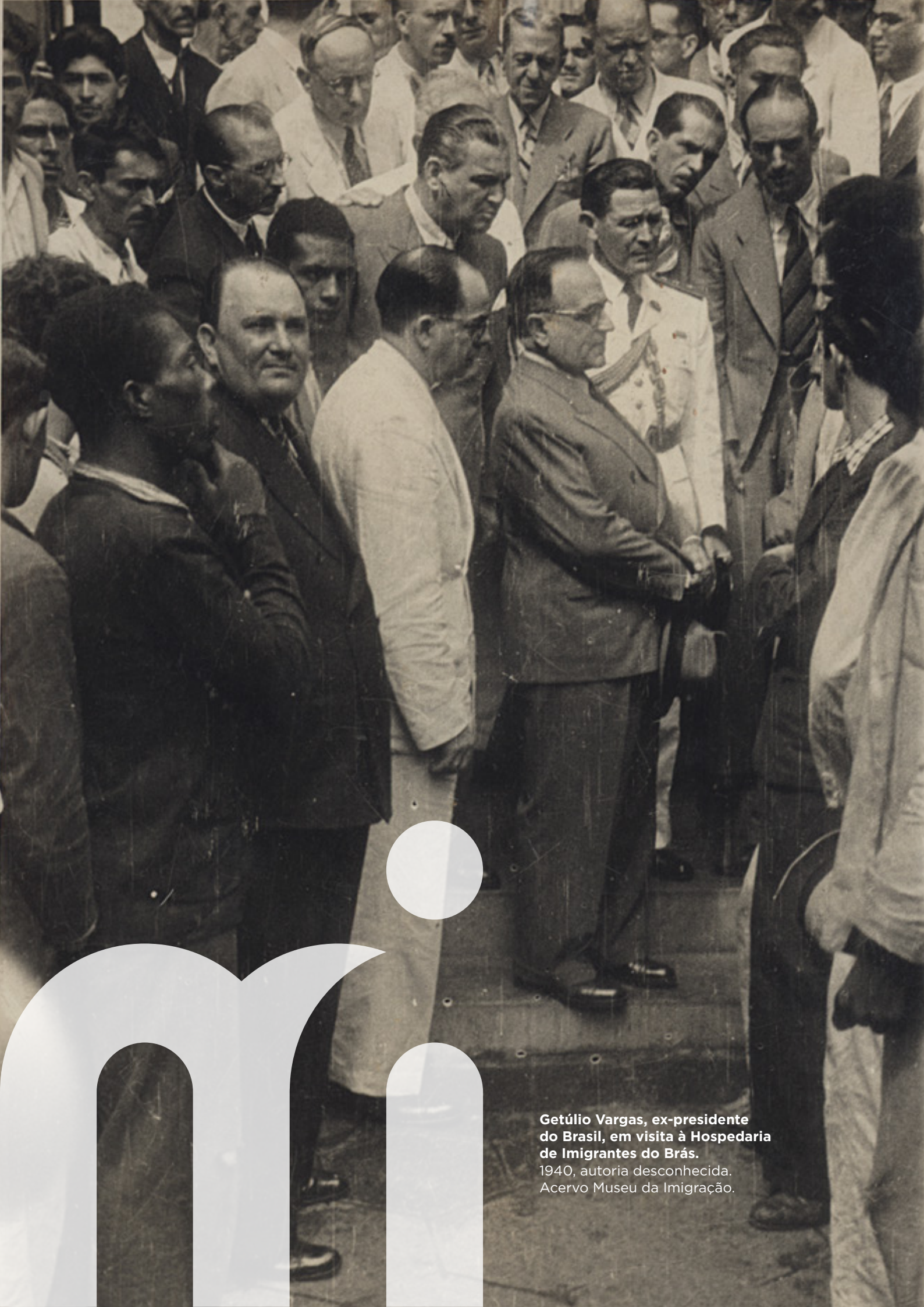
Getúlio Vargas, ex-presidente do Brasil, em visita à Hospedaria de Imigrantes do Brás. 1940