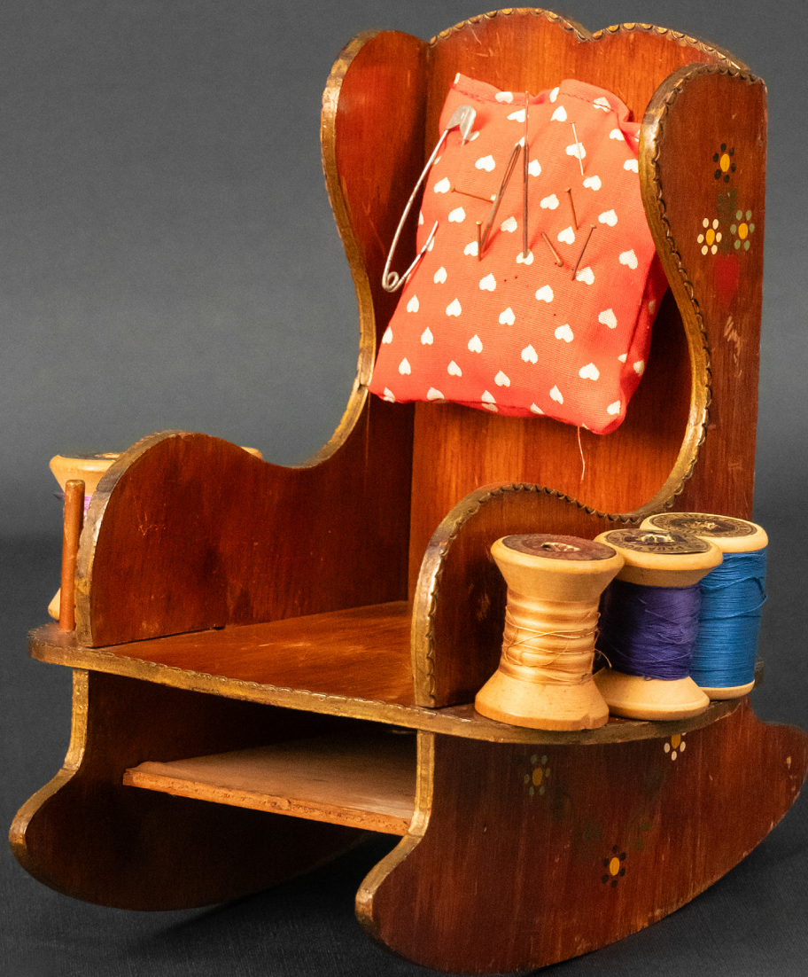
Porta carretéis e agulhas. Sem data, autoria desconhecida. Acervo Museu da Imigração. Foto: Black Pipe Entretenimento, 2025.