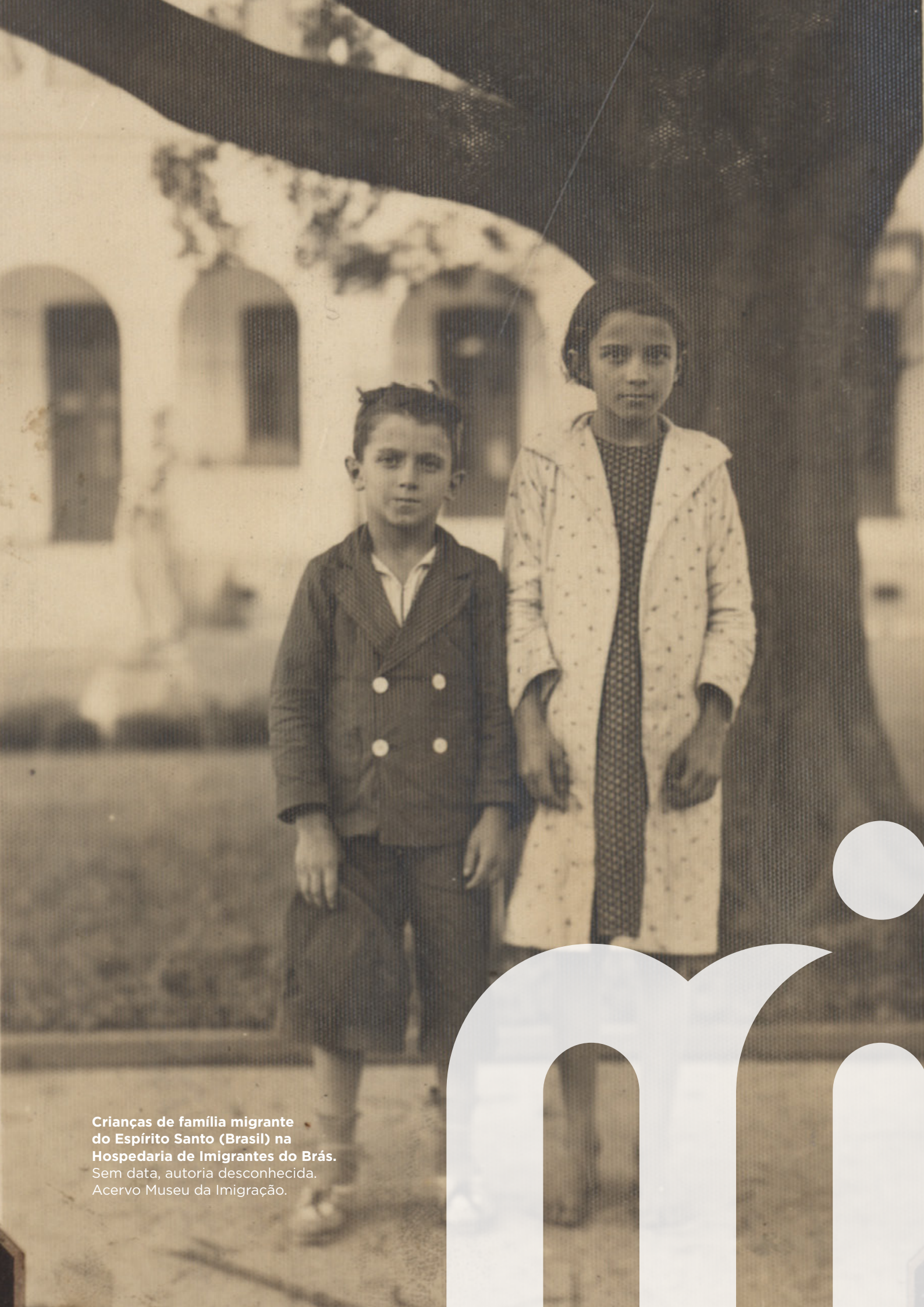
Crianças de família migrante do Espírito Santo (Brasil) na Hospedaria de Imigrantes do Brás. Sem data, autoria desconhecida. Acervo Museu da Imigração.