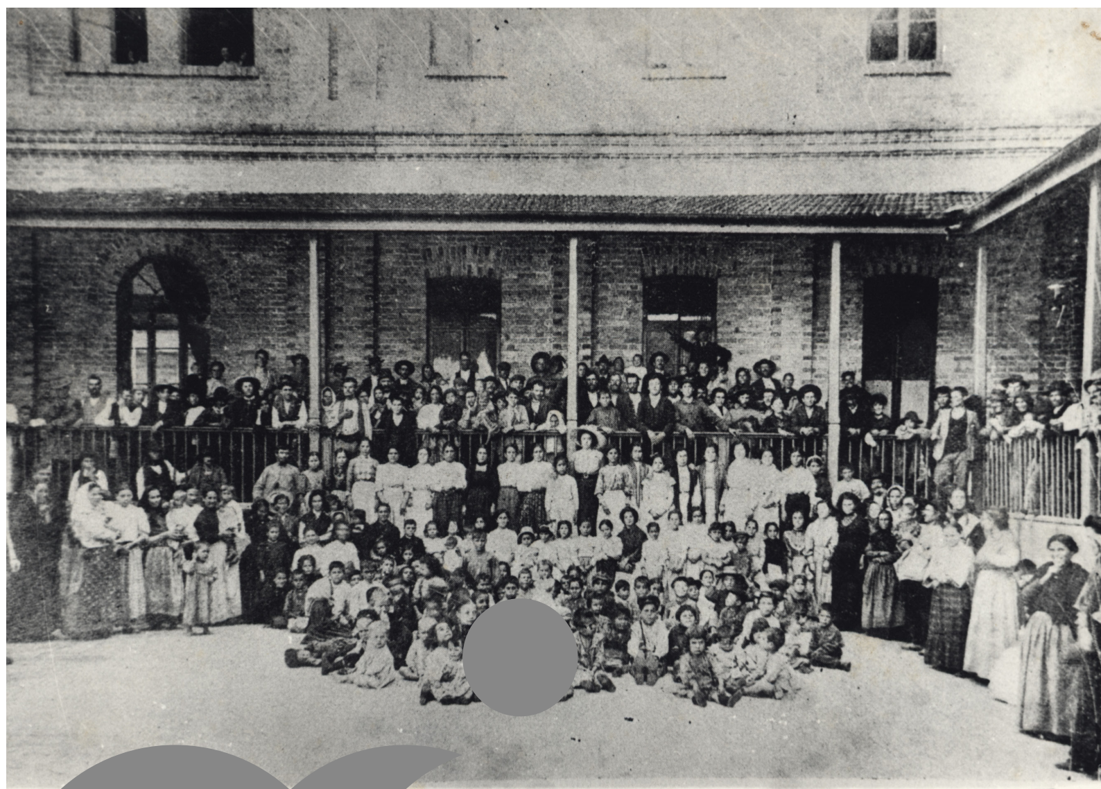
Grupo de migrantes internacionais na Hospedaria de Imigrantes do Brás. Sem data, autoria desconhecida. Acervo Museu da Imigração.