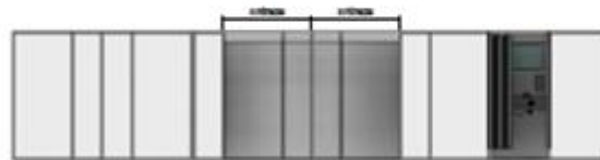
FACHADA FRONTAL Escala 1/100